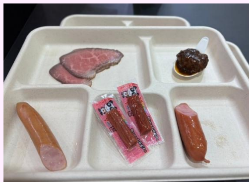
試食提供商品 (一例)