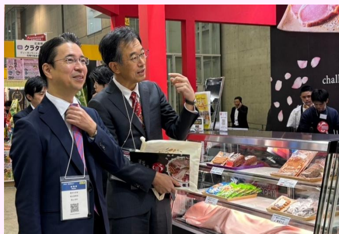
農林水産省 高山輸出促進審議官ご来訪