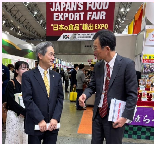
農林水産省 森輸出・国際局長ご来訪

本展示会共催である農林水産省の輸出・国際局長 森重樹氏、輸出促進審議官(兼輸出・国際局) 高山成年氏が開催2日目である11月28日(木)に来場し、ブースへご来訪いただきました。協議会側からの説明に日本産食肉加工品の魅力を再確認いただくとともに、当協議会の活動に一層のご賛同を頂きました。