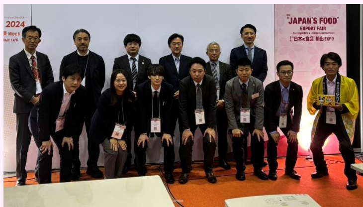
セミナー終了後、記念撮影

始めに日本産食肉加工品全体に対する紹介、その後に出展会員各社より今回制作した商品カタログをもとに自社及び自社商品紹介を行いました。